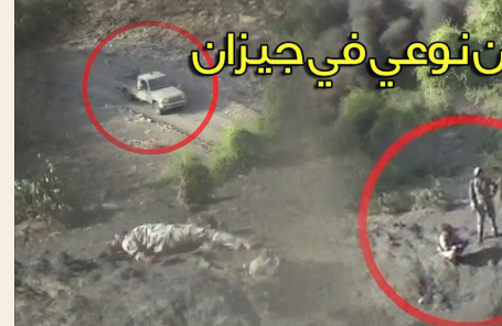
نوعيين في جيزان

والرمضة وكذلك في السوادة وموقع القمبر والطلوال كما استهدفت مرابض مدفعية الجيش السعودي في جبل قيس وتجمعاته وتحصيناته في موقع الخشل وجبل العزة بقطاع الداير وتدمير جرافة. ومره أخرى وفي عملياتها النوعية والذكية وفي ميدان البسالة والبطولة تسجل وحدة الهندسة العسكرية حضورها النوعي ففي جبهة جيزان خلال الأسبوع الماضي نفذت كمينين نوعيين محكمين دمر آليتين ومصرع ٥ جنود سعوديين ممن كانوا على متنهن. كما دمرت آلية أخرى يكمن نوعي آخر ومصرع جنديين سعوديين كانوا على متنها.