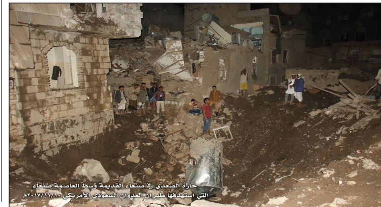
حارة الصعدي في صنعاء القديمة وسط العاصمة صنعاء التي استهدفتها غارات العدوان السعودي الأمريكي ٢٠١٥

يشار إلى أن طيران العدوان السعودي الأمريكي دأب على استهداف الصيادين