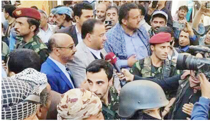
والصاف. ووجه السلطة المحلية بأمانة العاصمة بوضع المعالجات العاجلة لتسكين الأسر المتضررة ورعايتهم، كما

واطلع الرئيس الصماد على حجم الأضرار التي خلفها الاستهداف المتعمد والممنهج لطيران تحالف العدوان للمنطقة الأهلة بالسكان وإمعانه في استمرار ارتكاب المجازر والجرائم بحق الشعب اليمني منذ أكثر من عامين