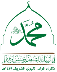
ذكرى المولد النبوي الشريف ١٤٣٩هـ

مولد الحبيب المصطفى رسول الله محمد صلوات ربي عليه وآله الأظهار الذي جاء ليحرر الإنسان من برائث العبودية للذات والشهوات