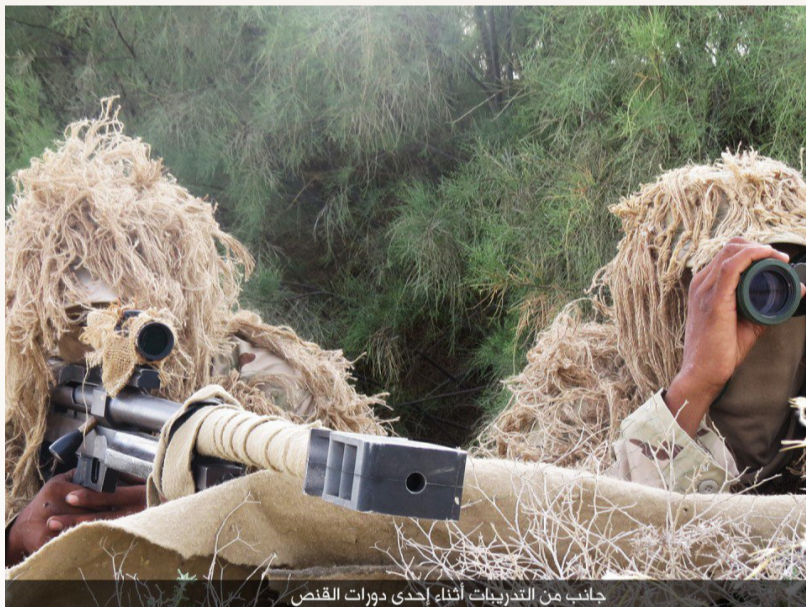
جانب من التدريبات أثناء إحدى دورات القنص

مصرع وجرح العديد من المرتزقة أثناء انكسار محاولة زحف شرق يختل بمديرية المخا وتبعوها بعملية اغارة أخرى على مواقع المنافقين في الهاملي بمديرية موزع ويحرقون آلية عسكرية وتكبدهم خسائر فادحة في الأرواح والعتاد وسيارات الاسعاف تهرع إلى المكان كما نفذ أبطال الجيش واللجان الشعبية عملية هجومية ثالثة على مواقع المنافقين في التبة السوداء بعصيفرة وسقوط قتلى وجرحى في صفوفهم وتبعها أبطالنا بعملية عسكرية نوعية رابعة على مواقع المنافقين غرب الدفاع الجوي وسقوط قتلى وجرحى في صفوف المنافقين خلال العملية العسكرية على مواقعهم غرب الدفاع الجوي فيما كانت العملية النوعية الخامسة على مواقع المنافقين باتجاه اللواء ٣٥ خلفت قتلى وجرحى في صفوفهم وفرار جماعي للمنافقين خلال العمليتين على مواقعهم باتجاه اللواء ٣٥ وغرب الدفاع الجوي كما شن أبطالنا هجوم نوعي خاطف على