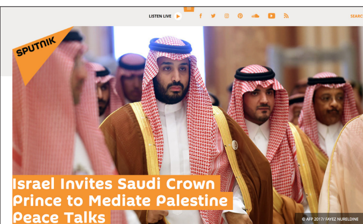
Israel Invites Saudi Crown Prince to Mediate Palestine Peace Talks

ولفتت الوكالة إلى إن قرار الرئيس الأمريكي دونالد ترامب اعتبار القدس عاصمة أبدية للدولة العبرية؛ أثار غضبا شديدا في العالم الإسلامي.