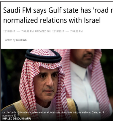
Saudi FM says Gulf state has 'roadmap' for normalized relations with Israel

وأكد وزير الخارجية أن السعودية ما زالت ملتزمة بحل الدولتين رافضا الإدعاءات القائلة