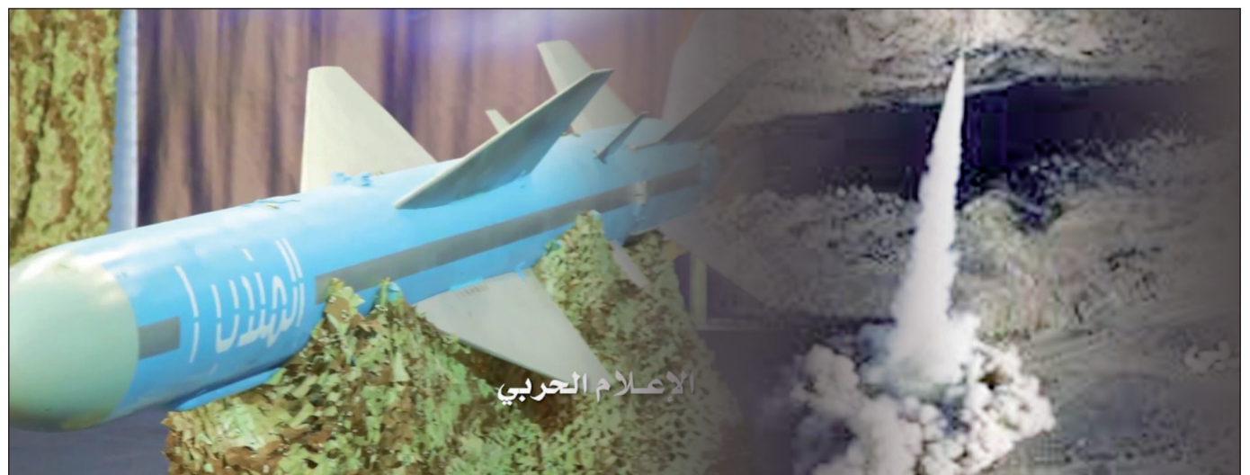
الذئب الباليستي القصير

استهدفت القوة الصاروخية للجيش واللجان الشعبية، مساء امس الأربعاء، بصاروخ باليستي خزانات شركة أرامكو السعودية في جيزان. وكانت القوة الصاروخية قد أطلقت، مساء الخميس الماضي صاروخاً بالبليستيا من طراز «بدر ١» على شركة أرامكو في جيزان. وسبق ذلك اي قبل اسبوع تقريباً اطلاق القوة الصاروخية صاروخاً بالبليستيا قصير المدى من طراز بدر ١ على شركة أرامكو النفطية في نجران... ذئب البليستية قصيرة مخادعة سريعة