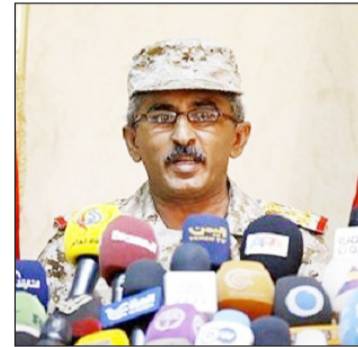
مرحل أقوى وأكثر تصعيداً، بعد الرشقات الصاروخية وهجمات الطيران المسير التي

حصلت اليوم، والتي تعتبر مصداقاً للوعد الحق.. وأوضح ناطق الجيش أن ضرب "قاصف" لمطار أنها تعد خطوة استراتيجية تضاهي الضربات الباليستية، مشيراً إلى أن الجيش اليمني اليوم أقوى من أي وقت مضى.. وكانت القوة الصاروخية نفذت هجمات بالباليستية مركزة بصواريخ "بركان تواتش" استهدفت وزارة الدفاع السعودية وأهداف أخرى في عاصمة العدوان الرياض، كما استهدفت مبنى توزيع أرامكو في نجران وأهدافاً أخرى في القطاع بدفعة من صواريخ "بدرا"، في حين قصف مدينة الملك عبدالله الاقتصادية وأهداف أخرى في جيزان.