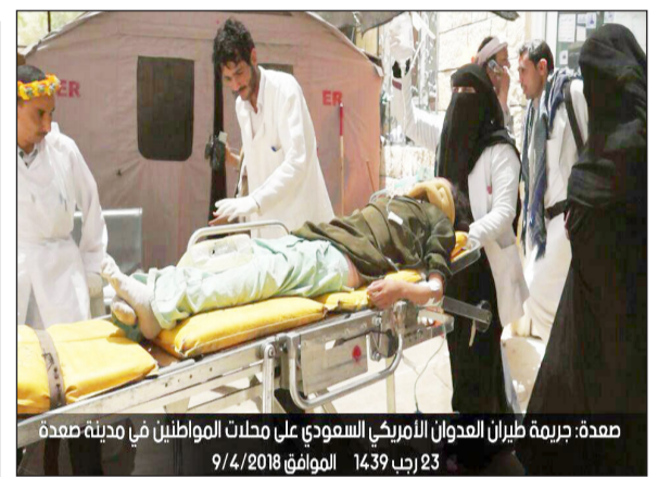
صعدة، جريمة طيران العدوان الأمريكي السعودي على محلات المواطنين في مدينة صعدة 23 رجب 1439 الموافق 9/4/2018

وفي محافظة الحديدة شن طيران العدوان غارتين شرق القطابة في مديرية الخوخة واستهدف بغارة وادي زبيد جنوب المحافظة . يذكر أن طيران العدوان الأمريكي السعودي شن أربع غارات شمال مديرية حرف سفبان بمحافظة عمران .