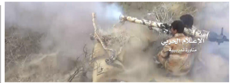
مناورة تدريبية