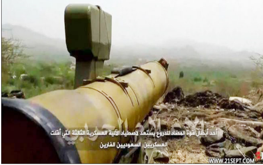
أحد أطنان قوة المضاد للدروع يستعد لإصطياد الآلية العسكرية الضخمة التي أُنشئت العسكريين السعوديين الفارين