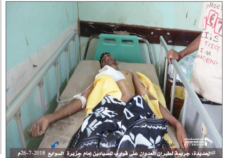
#الحديدة: جريمة لطيران العدوان على قوارب للصيادين امام جزيرة السوابع 26-7-2018م

واصل العدوان السعودي الأمريكي شن غاراته وعدوانه على محافظتي صعدة والحديدة مخلف شهداء وجرحى وأضرار في ممتلكات المواطنين.