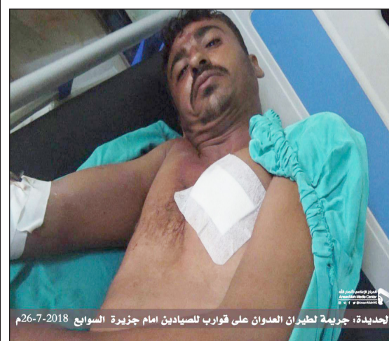
#الحديدة: جريمة لطيران العدوان على قوارب للصيادين امام جزيرة السوابع 26-7-2018م

استشهد 4 مواطنين وجرح 5 آخرين بينهم أطفال جراء غارات لطيران العدوان السعودي الأمريكي استهدفهم في محافظة الحديدة. وأفاد مصدر بأن طيران العدوان استهدف مواطنين أثناء مرورهم إلى منطقة كيلو 16 من مديرية الدريهمني. وأوضح المصدر أنه استشهد 4 مواطنين وجرح 5 آخرين بينهم أطفال. وذكر المصدر أن طيران العدوان شن غارتين على سكن المستشفى الريفي في مديرية الدريهمني. كما استهدف طيران العدوان بأربع غارات مركز الإرشاد الزراعي في نفس المديرية. في حين أصيب مواطن بجروح، بنيران حرس الحدود السعودي بمحافظة صعدة. وفي الجوف استهدف طيران العدوان بغارة سيارة مواطن بالطريق العام الرابط بين منطقتي رحوب والعنان بالجوف ما أدى إلى استشهاد مواطن ونجده وإصابة زوجته وطفلة.