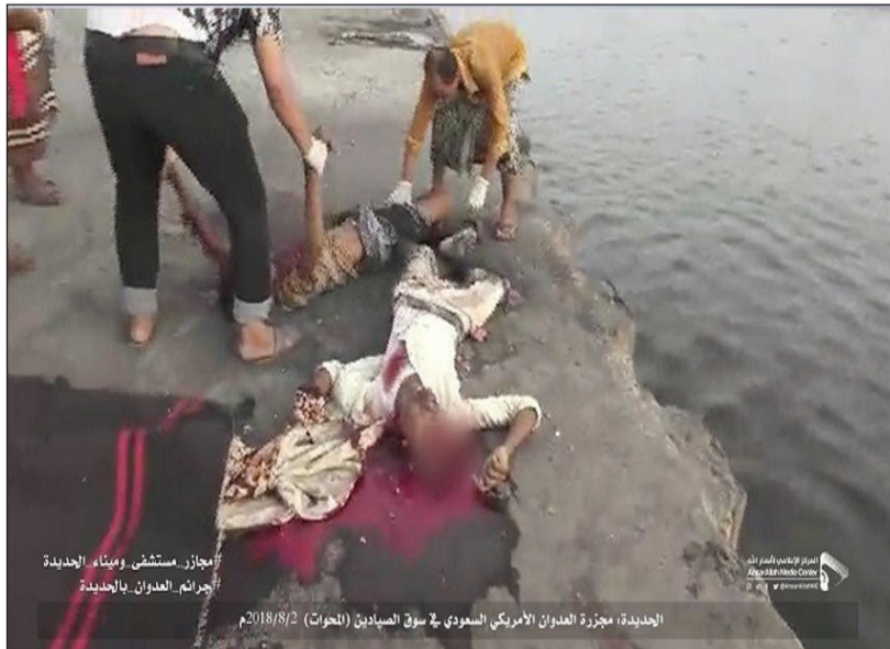
الحديدة، معزرة العدوان الأمريكي السعودي في سوق الصيادين (البحوث) 2018/8/2

وشهدت قرى أهلة بالسكان في مديرتي منبه ورازح الحدوديتين ومنطقة الغور بمديرية غمر قصفا صاروخيا ومدفعا سعوديا.