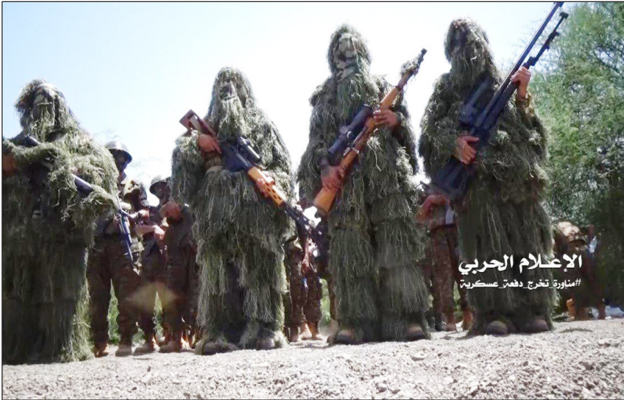
الإعلام الحربي الاستتار يخرج دفتراً عسكرياً