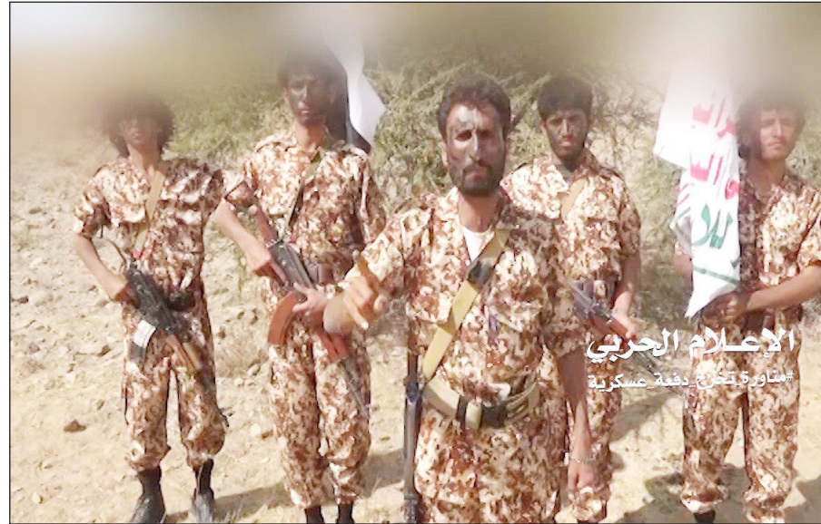
الإعلام الحربي الاستتار يخرج دفتراً عسكرياً