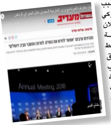
إحدى صفحات صحيفة «معاريف» الإسرائيلية، التي أشارت في تقريرها إلى قرار الرئيس الأمريكي دونالد ترامب إعلان القدس عاصمة للاحتلال، ووسط مطالبات بإلغاء اتفاق أوسلو والانسحاب من مسار التسوية الذي لم يجلب للقضية الفلسطينية سوى الضياع.

إسلامي عارم بسبب قرار الرئيس الأمريكي دونالد ترامب إعلان القدس عاصمة للاحتلال، ووسط مطالبات بإلغاء اتفاق أوسلو والانسحاب من مسار التسوية الذي لم يجلب للقضية الفلسطينية سوى الضياع.