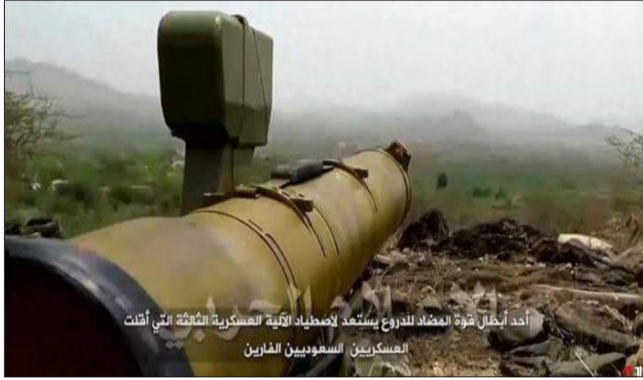
أحد أبطال قوة المضاد للدروع يستعد لإصعاب الآلية العسكرية الثقيلة التي أتت العسكريين السعوديين الفارين

تهدد أمن المنطقة وعلى اسرائيل حساب ذلك مستقبلاً مضيفا القول ان اعظم المقابر للآليات العسكرية في المنطقة منذ عقود طويلة هي التي احداثها الحوثيون بصواريخ الكورنيت المضادة للدروع. متسانلا من اين لهم كل هذه القاذفات والصواريخ من نوع الكورنيت التي تتجاوز الآلاف منها وهذه قضية معقدة تستدعي