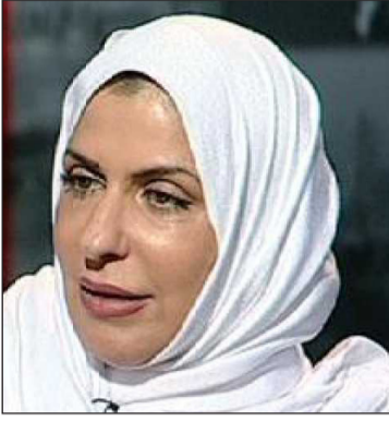
وبيّنت أنه لا يوجد اتصال بين المعتقلين وذويهم. واستكرت بنت سعود استمرار

كذلك انتقدت بسملة بنت سعود قطع العلاقات مع قطر، معلنة معارضتها لقطع العلاقات مع «الدول الأشقاء»، بحسب رأيها.